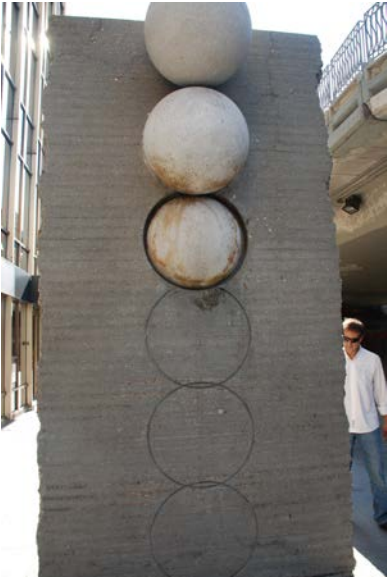
Título: Al otro lado del muro. José María Subirachs