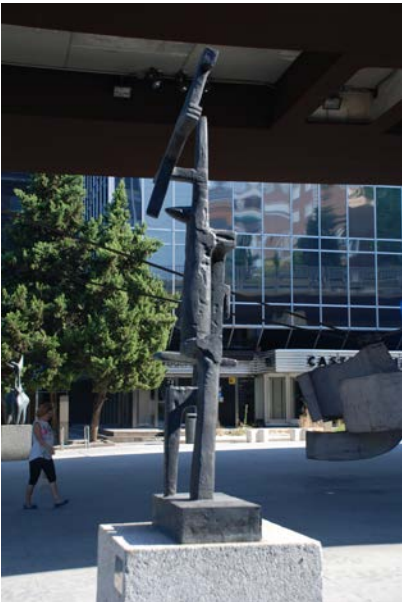
Título: La petite faucille. Julio González