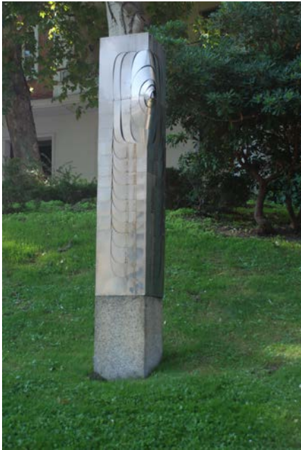
Título: Estela del Venus. Amadeo Gabino