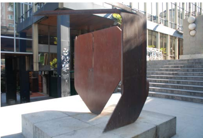
Título: Proyecto para un monumento IV-B. Pablo Palazuelo