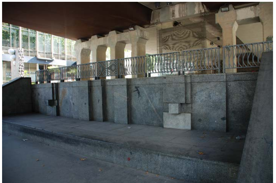
Título: Volumen-Relieve- Arquitectura. Gerardo Rueda