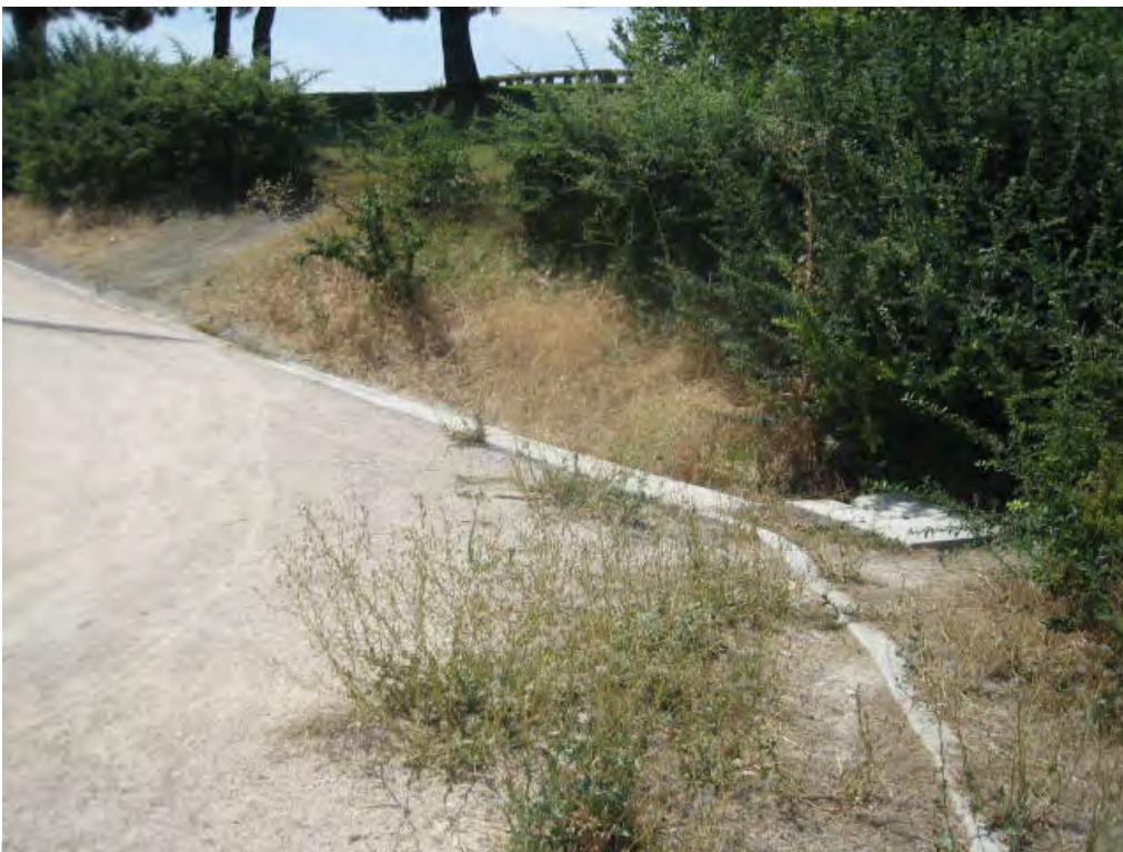
Parque Tierno Galván