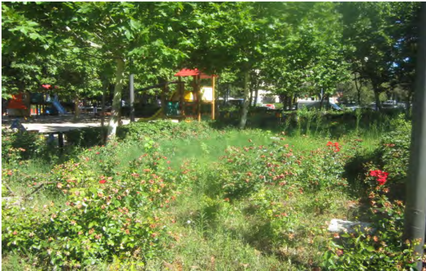
Polideportivo Pan Bendito