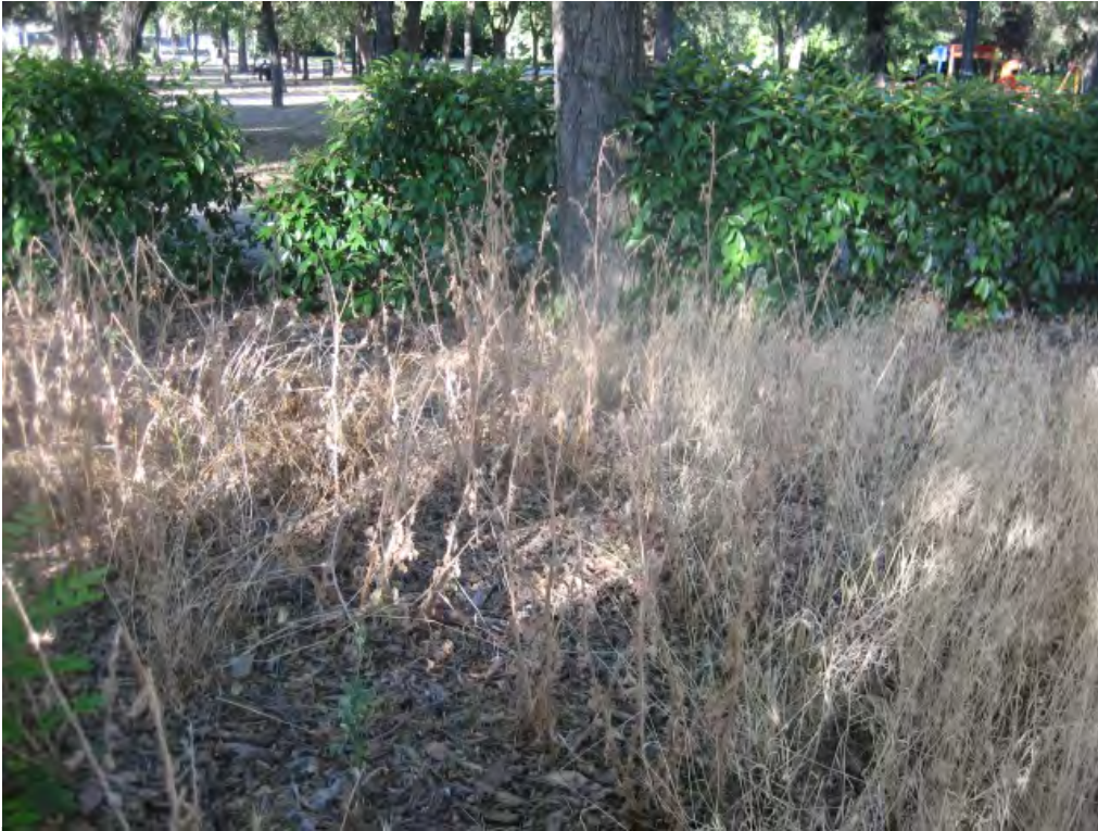
Parque Dehesa Boyal