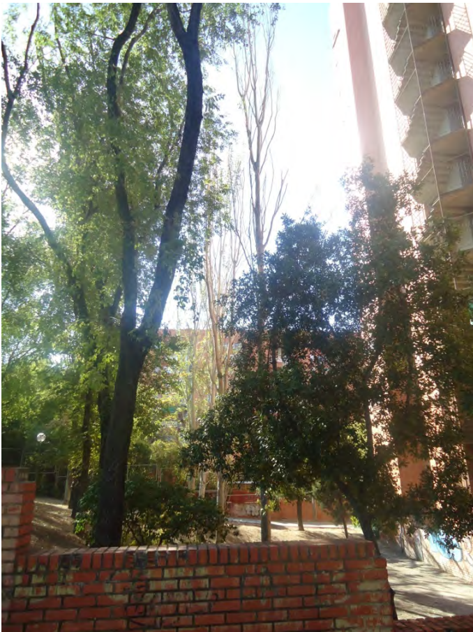
Avda. Miguel Hernández, 3