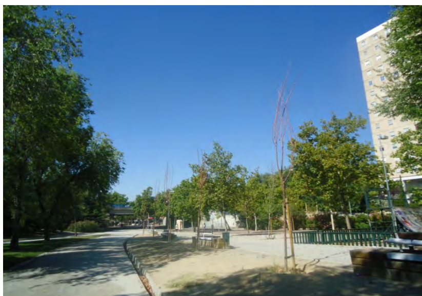
Parque Lineal Palomeras