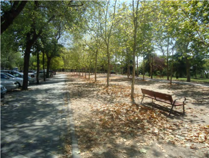
Parque de Entrevías