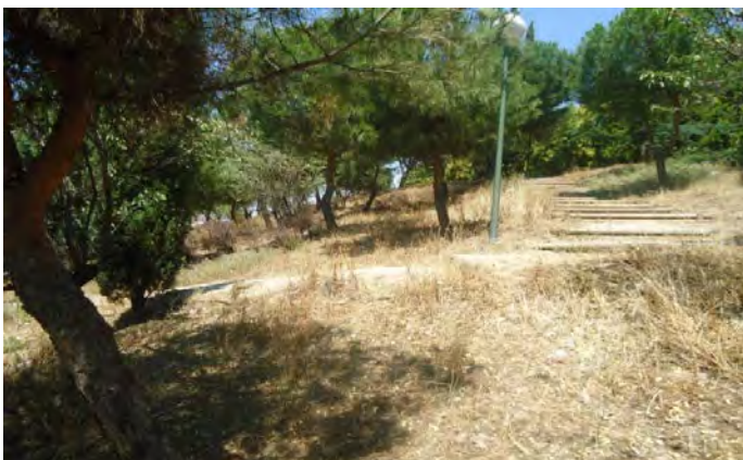
Parque Entrevías La Viña