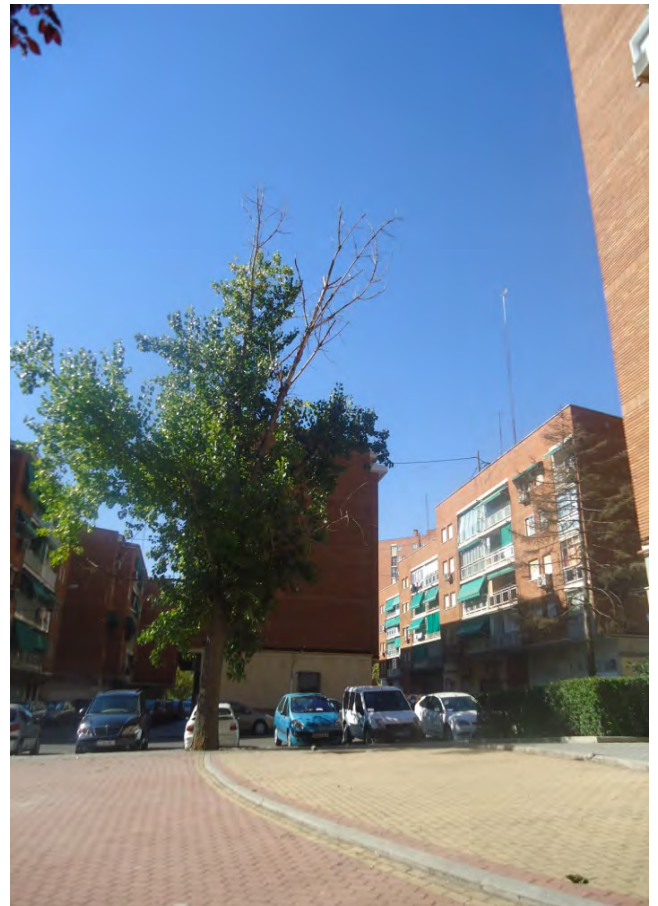
C/ San Claudio