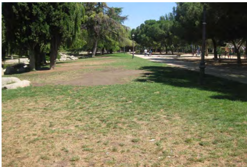
Parque de Aluche