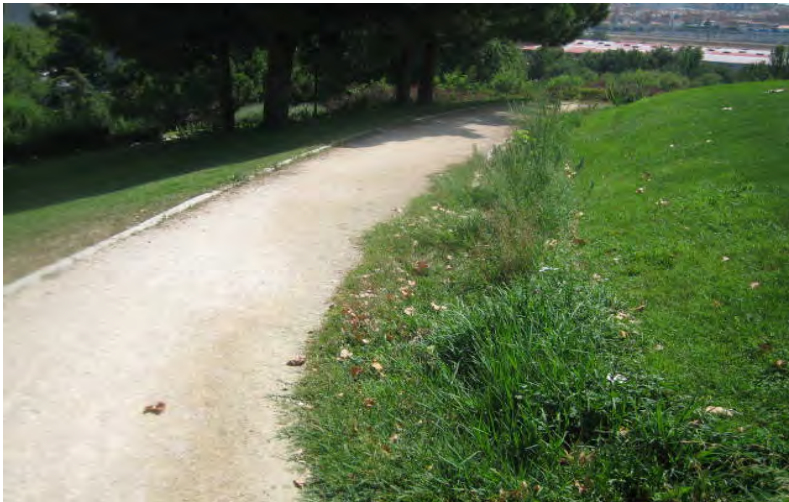
Parque Tierno Galván