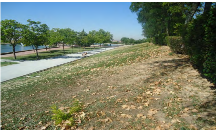
Parque Lineal de Palomeras