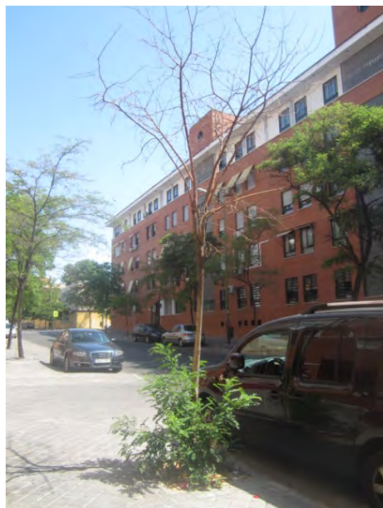
C/ Cenicienta, 13