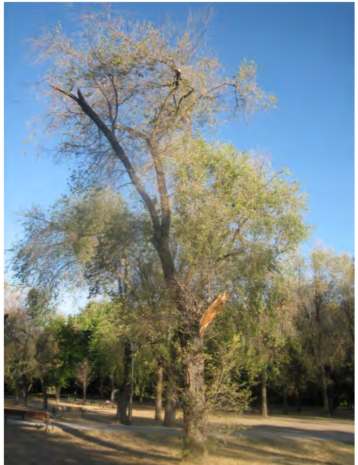
Parque Dehesa Boyal