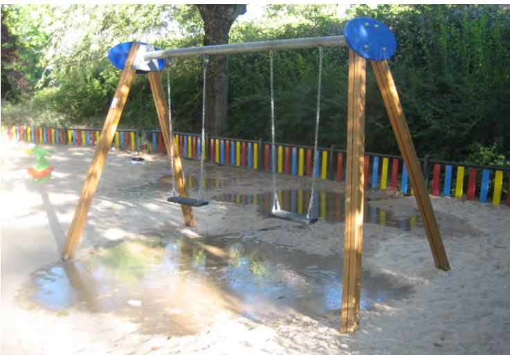
Parque Dehesa Boyal