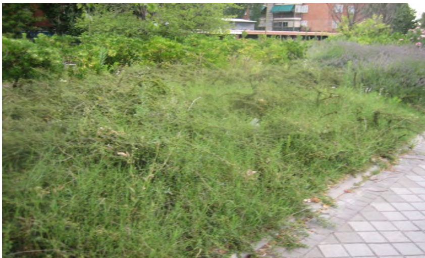
Avda. de los Poblados