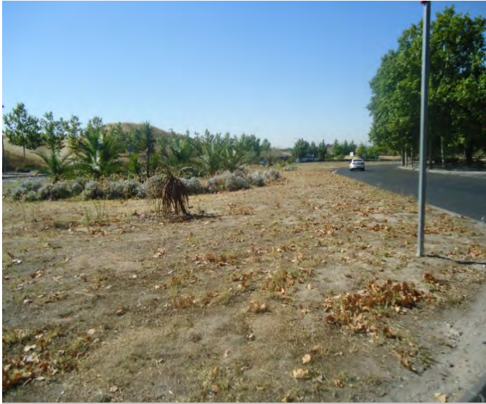
Avda. Buenos Aires