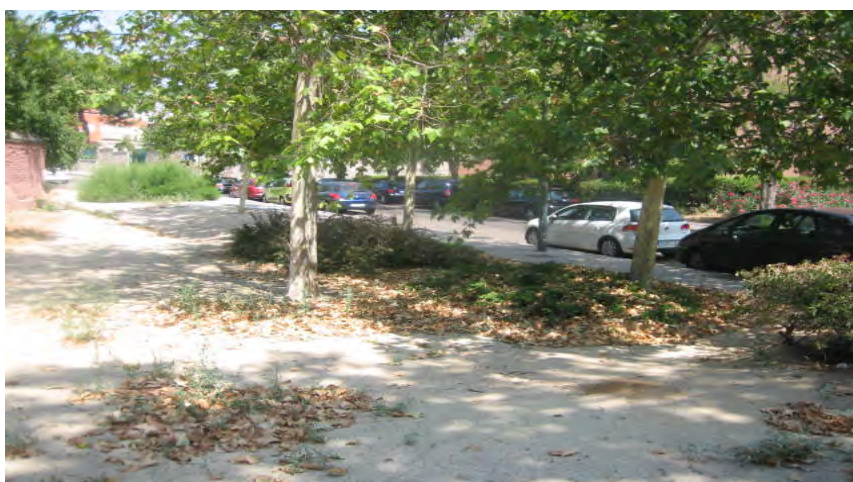
Parque Calle Alcalá, junto a Torre Arias