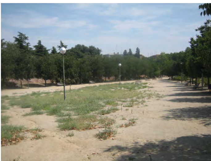
c/ Alcalá junto Torre Arias