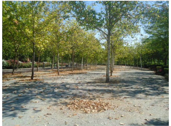
Parque Lineal de Palomeras