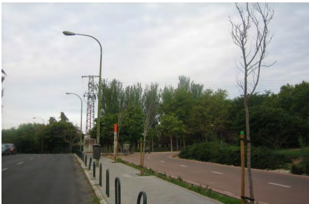
Parque de Las Cruces