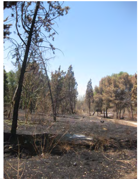
Parque Forestal Entrevías