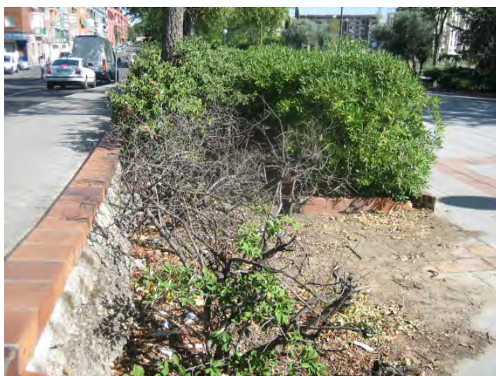
C/ San Jenaro