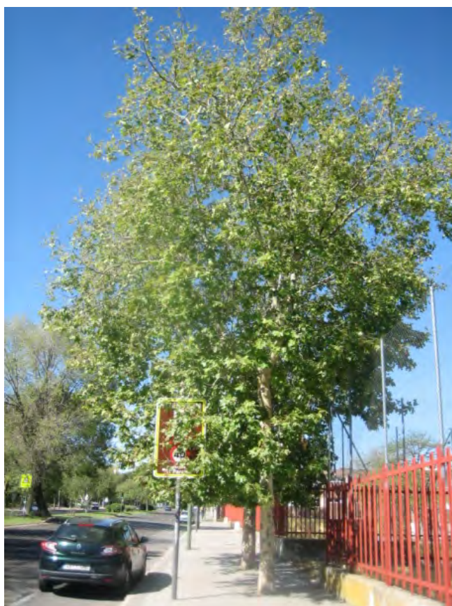
Parque El Paraíso