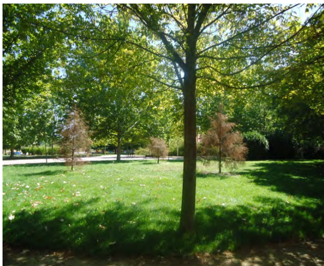
Parque Camino de Vasares