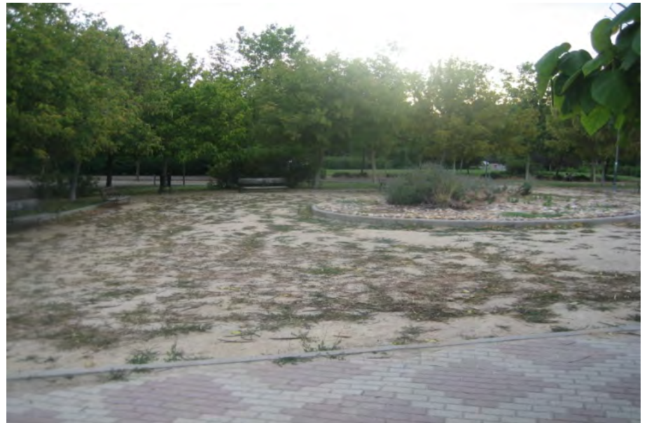
Parque de Las Cruces