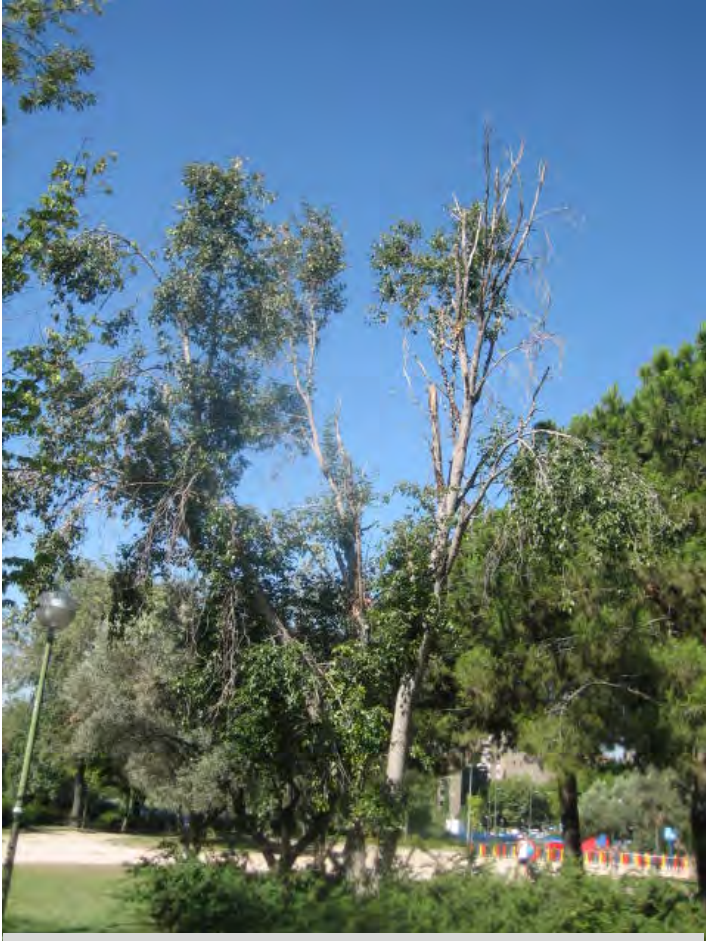
Camino Vinateros (c. comercial)