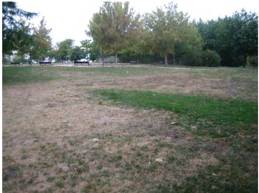
Parque de Las Cruces