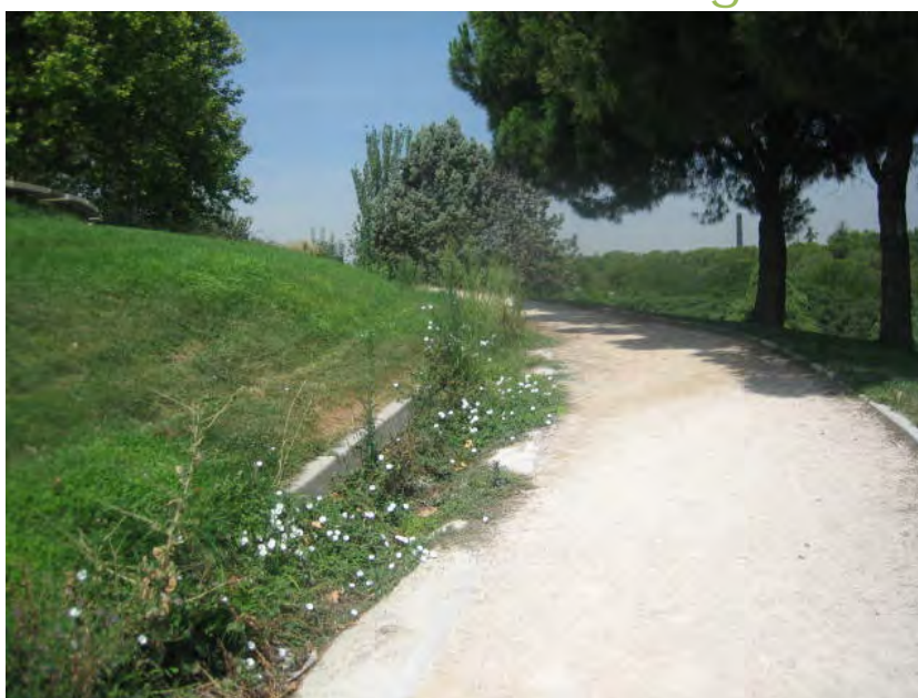
Parque Tierno Galván