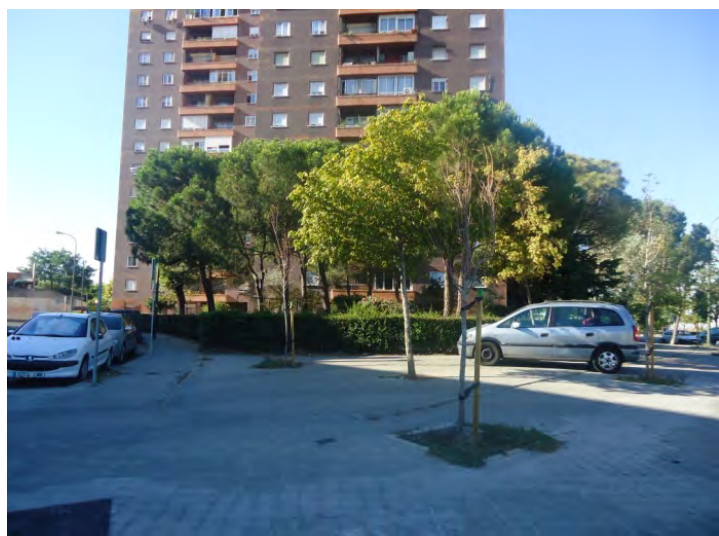
C/ Benjamín Palencia