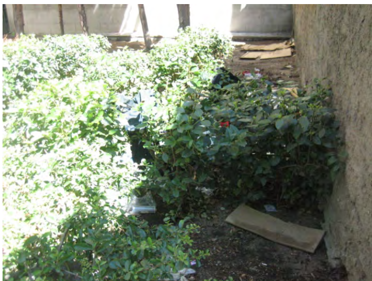
C/ Concepción Jerónima