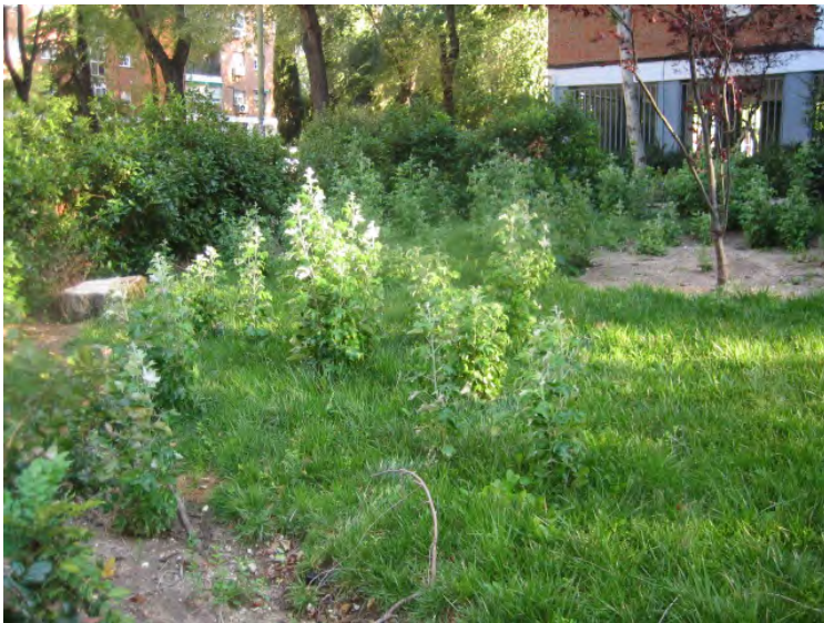
Parque San Luciano