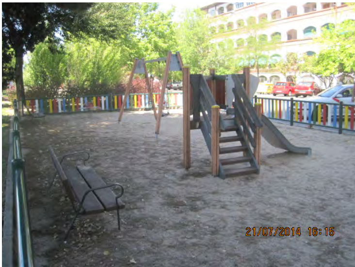
Paseo de la Castellana, 294