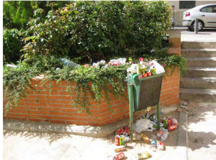
C/ Fray Junípero Serra