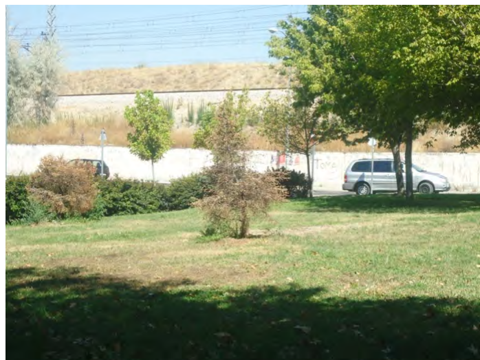
Parque Camino de Vasares