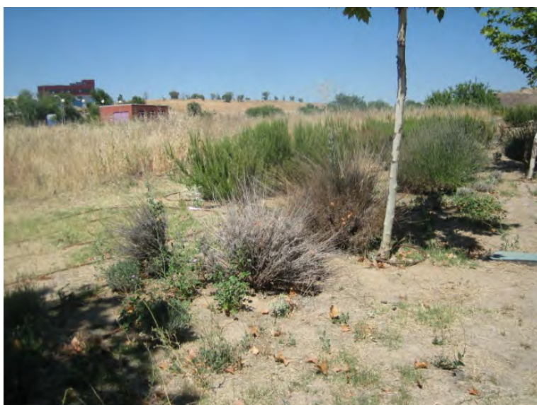
C/ Doctor García Tapia