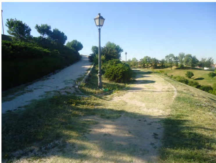
Parque Cerro Tío Pío